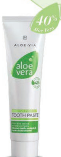
Aloe vera sensitive fogkrém

Fogkrém érzékeny fogakra, mindennapos használatra