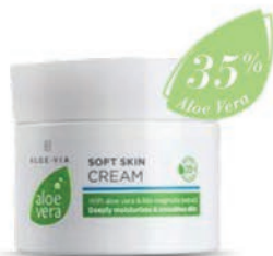
Aloe vera kímélő arc- és testápoló

20643 | 50 ml 7p 1.790,- (3.580 Ft/100 ml)