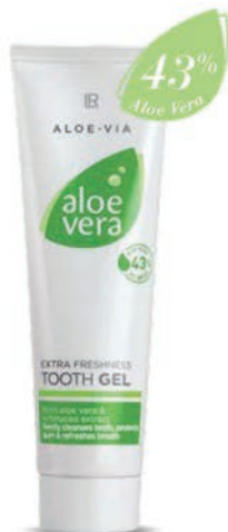
Aloe vera fogkrém

Ápolás és védelem az egész családnak. Az Aloe Via termékcsalád alábbi termékei kötelező darabok. Ezekkel igazán jól indul minden nap!