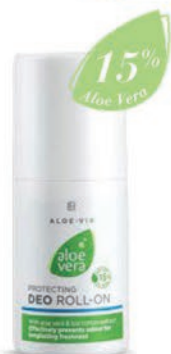
Aloe vera alkoholmentes golyós dezodor